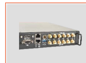
+ 6 встроенных модемов в версии LU610-M